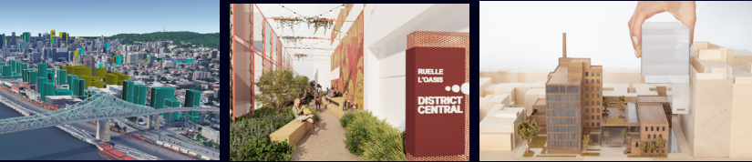
Futurs projets dans le secteur du Quartier Molson (en vert), montage par Agora Forum Montréal Ruelle L'Oasis, Plan d'interventions Signature District Central. Un projet signé par : SDC District Central & Les Immeubles HS. Conception : Projet Paysage Réhabilitation de l'Institut thoracique de Montréal. Crédit : NEUF Architect(e)s

Exposants additionnels 2025, en plus des partenaires officiels qui exposent, en date du 26 août