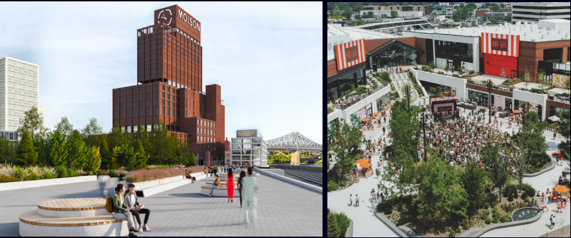
Projet Quartier Molson, Groupe Montoni Vue du projet Royalmount du promoteur immobilier Carbonleo