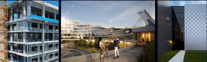
Le nouvel Hôpital de Vaudreuil-Soulanges, un projet de Soprema. Hôtel Urbain - Parc Olympique | Arrondissement Mercier-Hochelaga-Maisonneuve | Perspectives 3D : Provencher_Roy Projet d'agrandissement de l'entrepôt de Browns Shoes à Montréal par GKC Architecture Design.