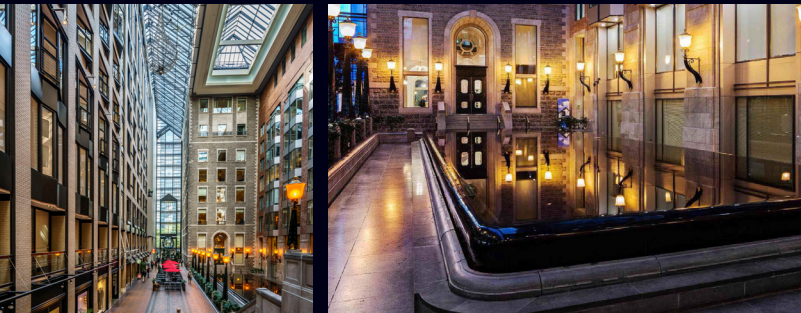
Centre de Commerce Mondial de Montréal

Présentation de multiples projets par des panneaux visuels, bandes vidéo et maquettes 3D